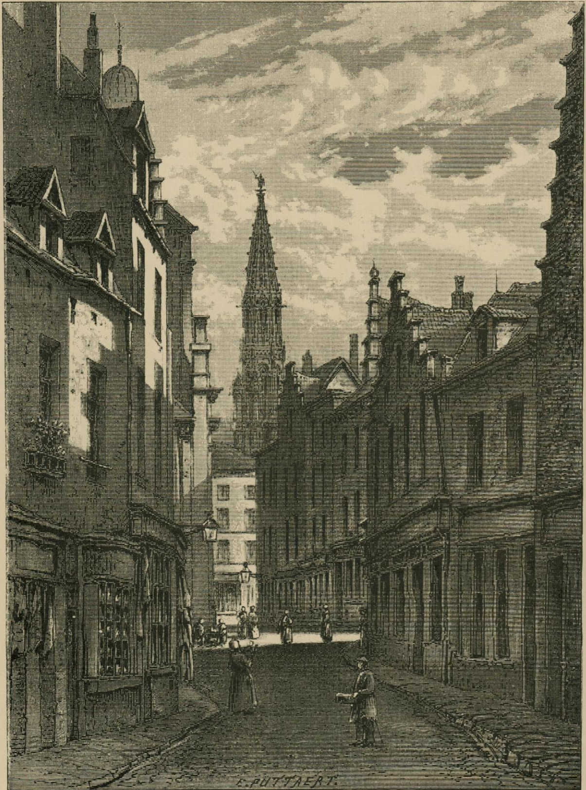
LA RUE DE LA PETITE-ILE EN 1862. Dessin original de Puttaert.